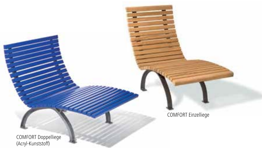
COMFORT Doppelliege (Acryl-Kunststoff)