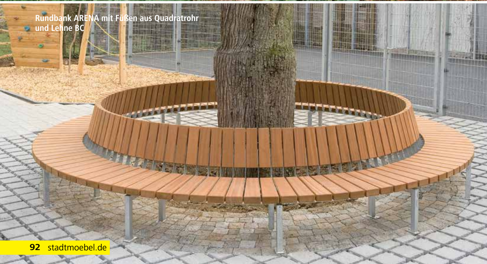
Rundbank ARENA mit Füßen aus Quadratrohr und Lehne BC