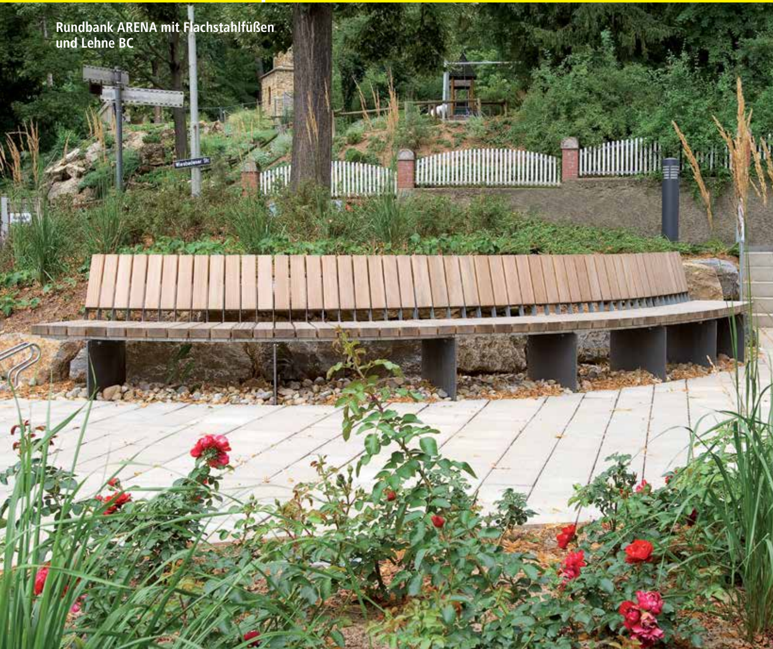
Rundbank ARENA mit Flachstahlfüßen und Lehne BC