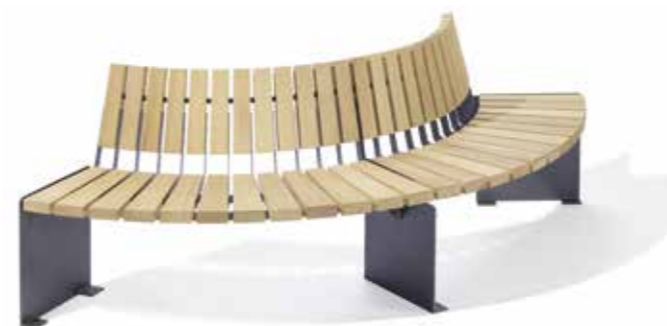
Rundbank ARENA mit Flachstahlfüßen und Lehne BC