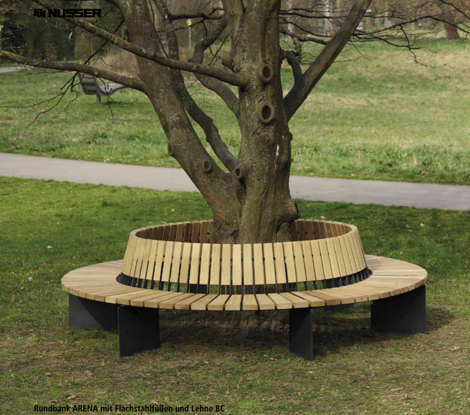
Rundbank ARENA mit Flachstahlfüßen und Lehne BC