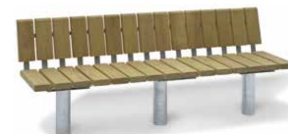
ARENA 200-ML mit Lehne PS