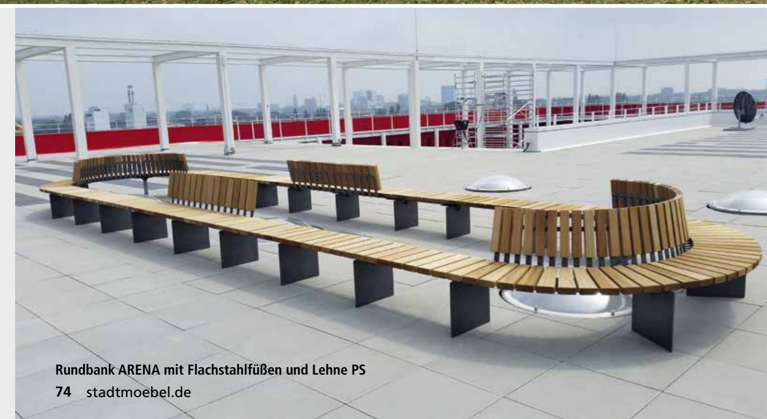
Rundbank ARENA mit Flachstahlfüßen und Lehne PS