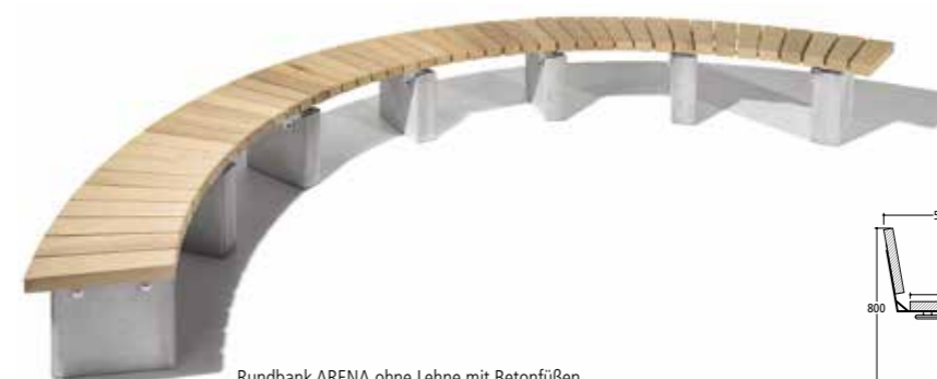
Rundbank ARENA ohne Lehne mit Betonfüßen