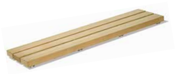
Bankauflage KH 3 gerade