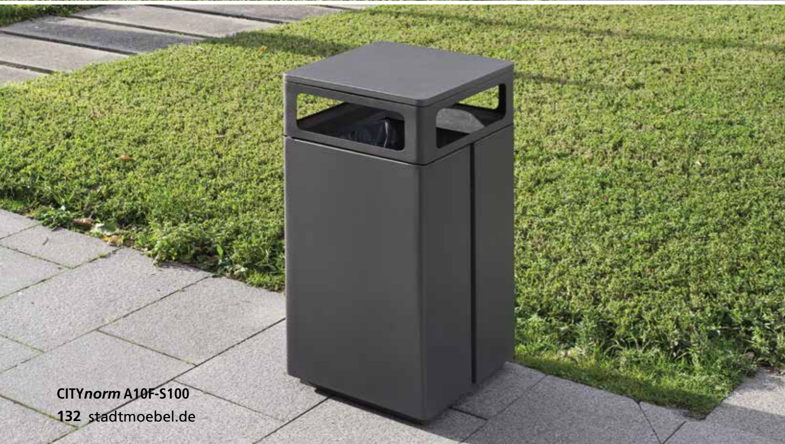
CITYnorm A10F-S100 132 stadtmoebel.de