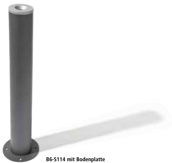
B6-S114 mit Bodenplatte