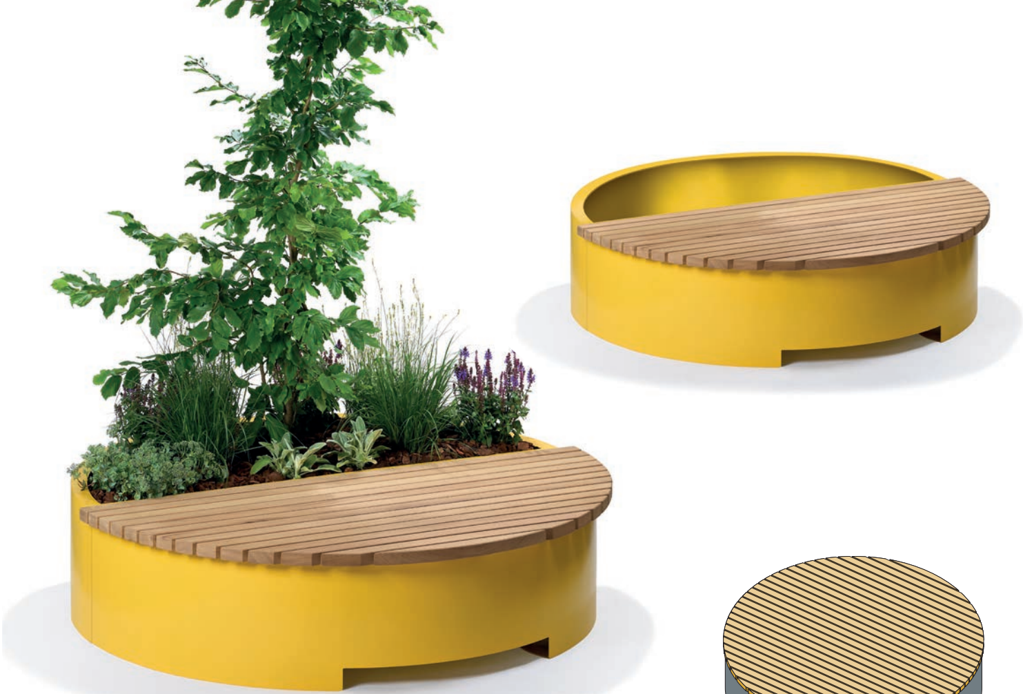
Abbildung zeigt RONDO in Sonderfarbe GELB